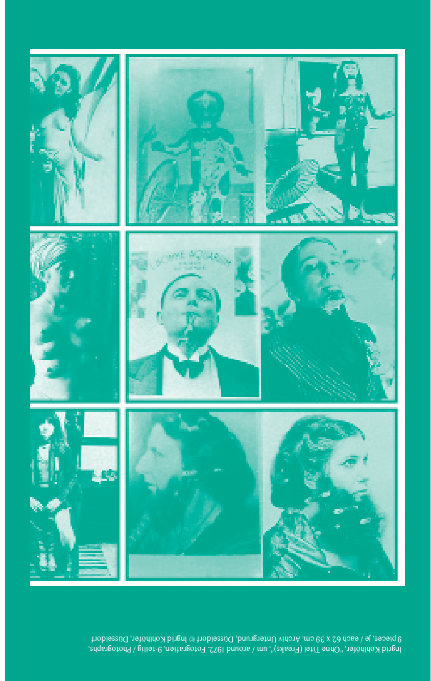
Ingrid Kahlhöfer: „China Titel (Freaks)“, um / around 1972, Fotografien, 9-Teilig / PhotoWorks. 9 pieces / 9 each 92 x 93 cm, Archiv (Untergrund, Düsseldorf) © Ingrid Kahlhöfer, Düsseldorf