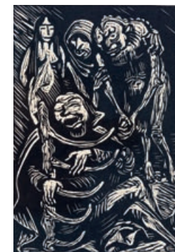
Der Harfner / The Harper, 1923