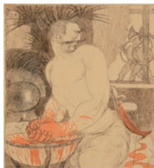
Marokko-Lärm / Morocco Hubbub, 1906