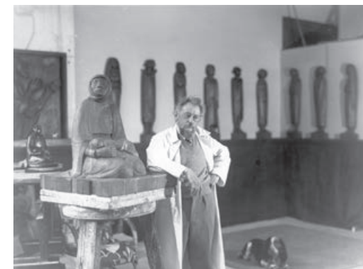
Ernst Barlach in seinem Atelier / in his studio, 1935

‘Becoming, That’s the Word!’ presents sculptures, drawings and prints from the Ernst Barlach Haus collection. The exhibition is a joint project with the Department of Art History, Universität Hamburg.