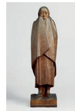
Frierendes Mädchen / Freezing Girl, 1917