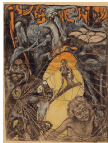
Im Zauberwald / In the Enchanted Wood, 1899