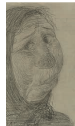
Kopf einer Säuerin / Head of a Drinker, 1906