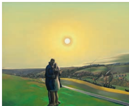
Wolfgang Mattheuer: Das vogtländische Liebespaar / Vogtland Lovers, 1972 Albertinum / Galerie Neue Meister, Staatliche Kunstsammlungen Dresden

In early 2020 the Dresden Albertinum opens an extensive Barlach retrospective significantly based on items from the Ernst Barlach Haus. The project is the occasion for an East/West exchange: in return the Albertinum loans major works from its collection of art in the GDR. The presentation covers post-war paintings and sculptures, 'socialist contemporary art' from the 1960s and 70s and works by a younger generation of artists. A wide spectrum of styles and positions can be discovered – from objective to expressive, figurative to abstract, conformist to critical.