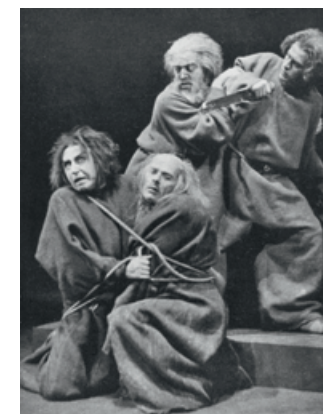
Barlachs Drama Die Sündflut im Stadttheater Köln / Barlach’s play The Flood at the Stadttheater in Cologne, 1927

© für Wolfgang Mattheuer: VG Bild-Kunst, Bonn; Cover: Ernst Barlach: Der Puppenspieler / The Puppeteer (Detail), 1922, Ernst Barlach Haus; Alle Werke auf dieser Seite / all works on this page: Ernst Barlach Haus, außer/except Pinkhouse: Besitz des Künstlers / Collection of the artist